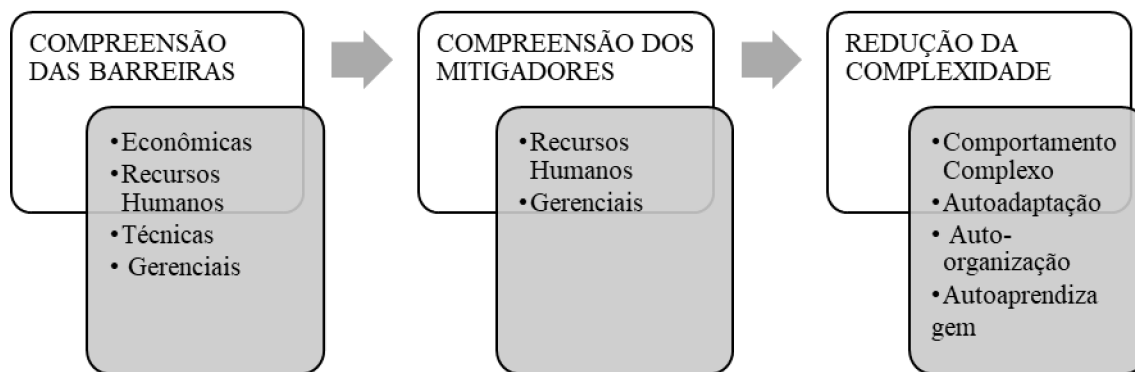
Figura 1 - Modelo Tentativo de Pesquisa

Inicialmente o modelo tentativo da pesquisa focou no levantamento e mapeamento na literatura das principais barreiras que dificultam o processo de adoção da Indústria 4.0. A partir desse diagnóstico, foi possível identificar e compreender quais são e como essas barreiras impactam no processo de adoção da Indústria 4.0. A segunda etapa focou em identificar ações que possibilitam reduzir ou mitigar as barreiras já levantadas e mapeadas na literatura. Através do levantamento da literatura e dos achados das entrevistas, foi possível compreender que as ações mitigadoras associadas aos Recursos Humanos e a atividade Gerencial, são as que têm impacto em todo o conjunto de macrobarreiras financeiras, de recursos humanos, técnicas ou gerenciais identificadas. O amplo entendimento das barreiras e das ações mitigadoras possibilita também um melhor entendimento do comportamento complexo associado ao cenário digital da Indústria 4.0. Nesse contexto, a terceira etapa busca, por meio dos princípios de autoadaptação, auto-organização e autoaprendizagem, reduzir essa complexidade relacionada à arquitetura da indústria 4.0 e ao grande volume de interação entre os atores para tornar-se mais assertiva no estabelecimento de ações mitigadoras que possibilitem a redução das dificuldades impostas pelas barreiras.