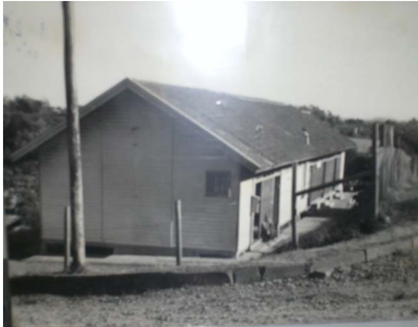
Primeiro prédio da escola. Data da década de 60, conforme relato da Equipe Diretiva da Escola

Os anos passaram e a comunidade no seu entorno cresceu e se desenvolveu. A necessidade de sua ampliação foi tornando-se evidente e, a partir do ano de 2002, já nomeada Escola Municipal de Ensino Fundamental Senador Salgado Filho, iniciou-se a implantação gradativa dos anos finais do Ensino Fundamental. A escola foi ampliada e, no ano de 2003, concluído o novo prédio, o qual mantém atualmente 716 (setecentos e dezesseis) alunos, distribuídos entre o Ensino Fundamental de 8 (oito) e 9 (nove) anos. Conta, também, com 44 (quarenta e quatro) professores e 7 (sete) funcionários. A equipe diretiva é composta pela diretora, por uma vice-diretora e duas supervisoras.