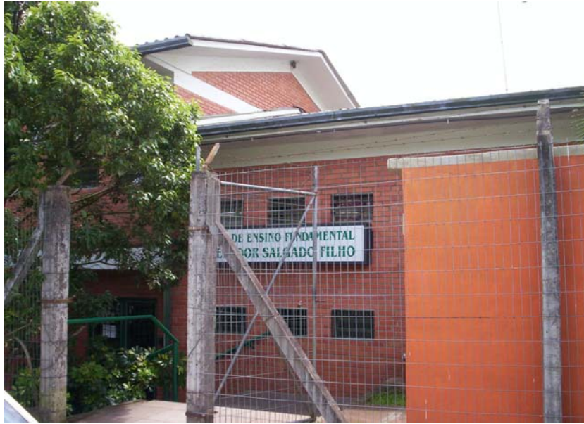
Entrada principal da Escola. Data da fotografia: 16/05/2007.