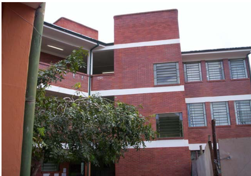
Vista interna da escola. Data da fotografia: 16/05/2007.

Esse novo cenário trouxe à escola novas expectativas e diferentes realidades – os professores que atuavam com estas turmas tinham um perfil diferenciado dos professores que atuavam nos anos iniciais do Ensino Fundamental. Emergia, também, entre outros sentimentos que permeavam o cotidiano da supervisão escolar, a inquietude e a certeza de que teriam um novo desafio: articular o grupo, mantendo-o unido, pois, conforme uma das Supervisoras: