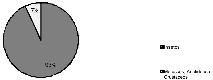
Figura 2. Macroinvertebrados mais freqüentes nos arroios da bacia do Rio dos Sinos: insetos aquáticos (93%) e moluscos, anelídeos e crustáceos que representaram 7% da amostragem