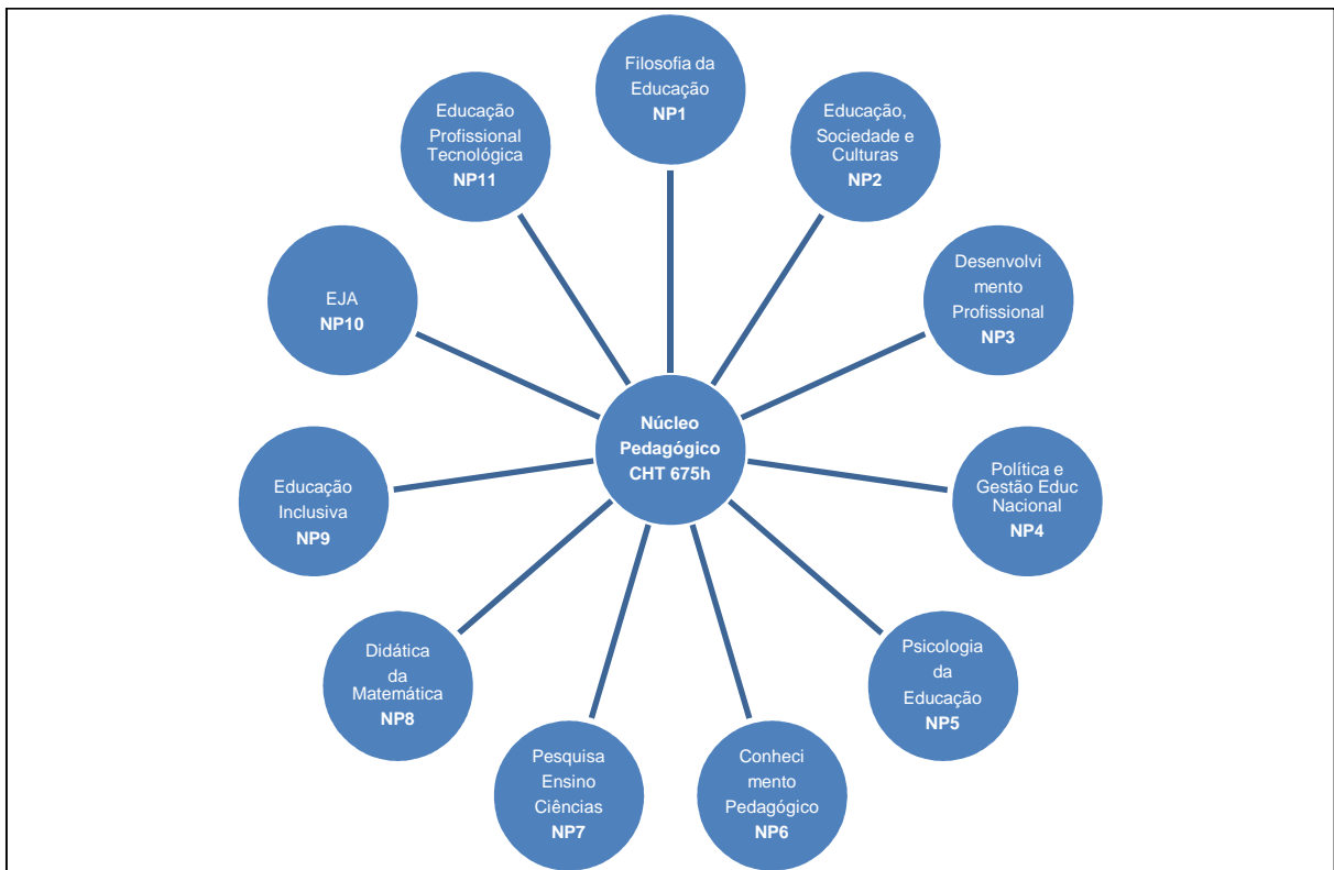
Figura 3 - Componentes Curriculares do Núcleo Pedagógico