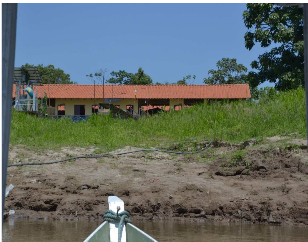
Figura 10 - Escola no período da vazante das água

De acordo com o laudo antropológico realizado pela Fundação Palmares para o Ministério da Cultura (2004), informa que novo prédio da Escola foi fundado em 12 de abril de 2002. Apesar de ser uma construção nova, contendo três pavilhões, enfrenta alguns problemas como, por exemplo, a iluminação e gerada somente por um painel solar que ilumina durante uma hora e meio um pavilhão. Para melhor localização e entendimento geográfico, apresento a imagem da escola no período do verão, em que ocorre o “fenômeno das terras caídas”, fenômeno da vazante das águas e grande quantidade de pescados.