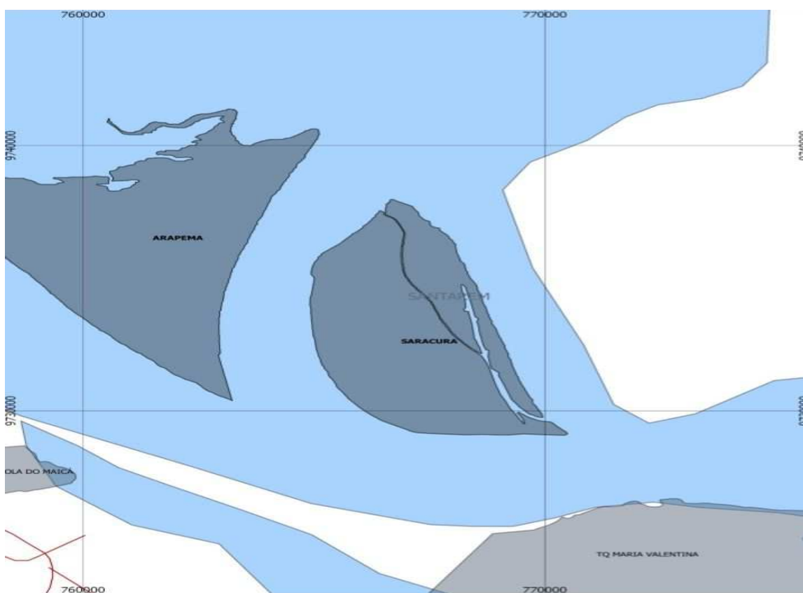
Figura 6 - Mapa da Comunidade de Saracura.

Para melhor localização geográfica da comunidade de Saracura fiz um recorte do mapa da Nova cartografia social da Amazônia. A comunidade é rodeada por afluentes, lagos com fartura de piranhas, pacú, surubim, arauã, acari, peixes típicos da região. Em Santarém, a comunidade é conhecida pela riqueza de mucajá e buritizal, frutas típicas utilizados na gastronomia local.