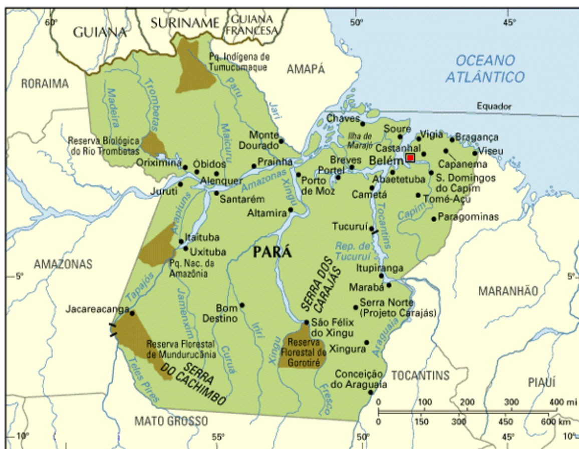
Figura 2 - Mapa do Estado do Pará, Santarém e cidades circunvizinhas