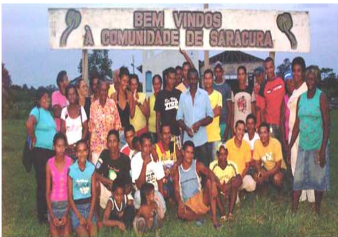
Figura 4 - Moradores da Comunidade de Saracura, por ocasião do projeto Nova Cartografia Social da Amazônia, parceria FOQS, em 2008.