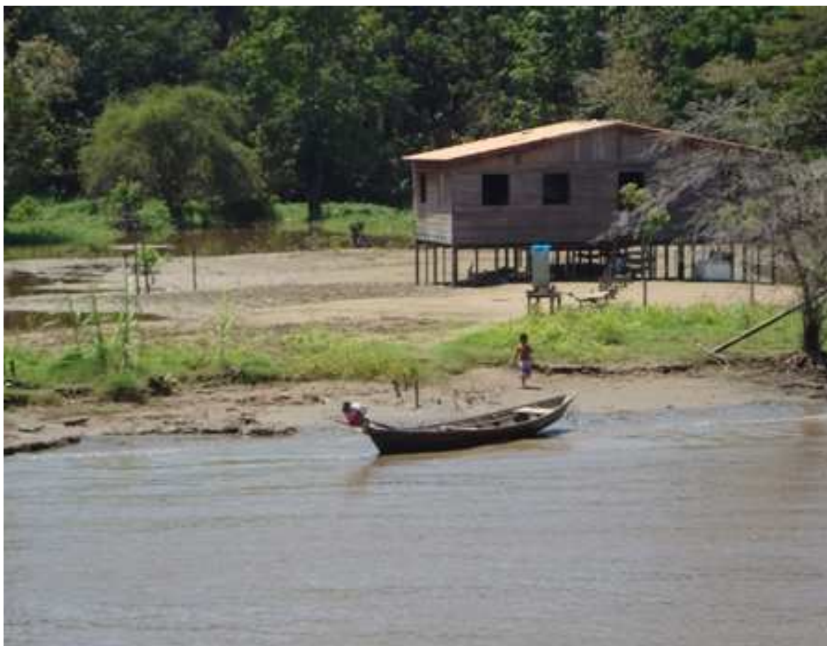
Figura 3 - Imagem do contexto ribeirinho onde se localizam as comunidades de quilombos