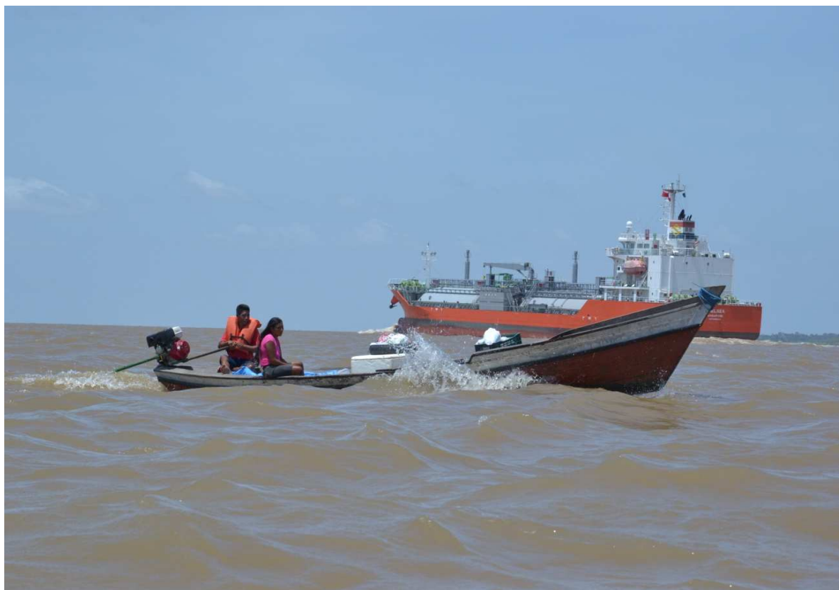
Figura 9 - O meio de transporte mais utilizado pelos ribeirinhos em direção ao quilombo de Saracura em Santarém Pará.