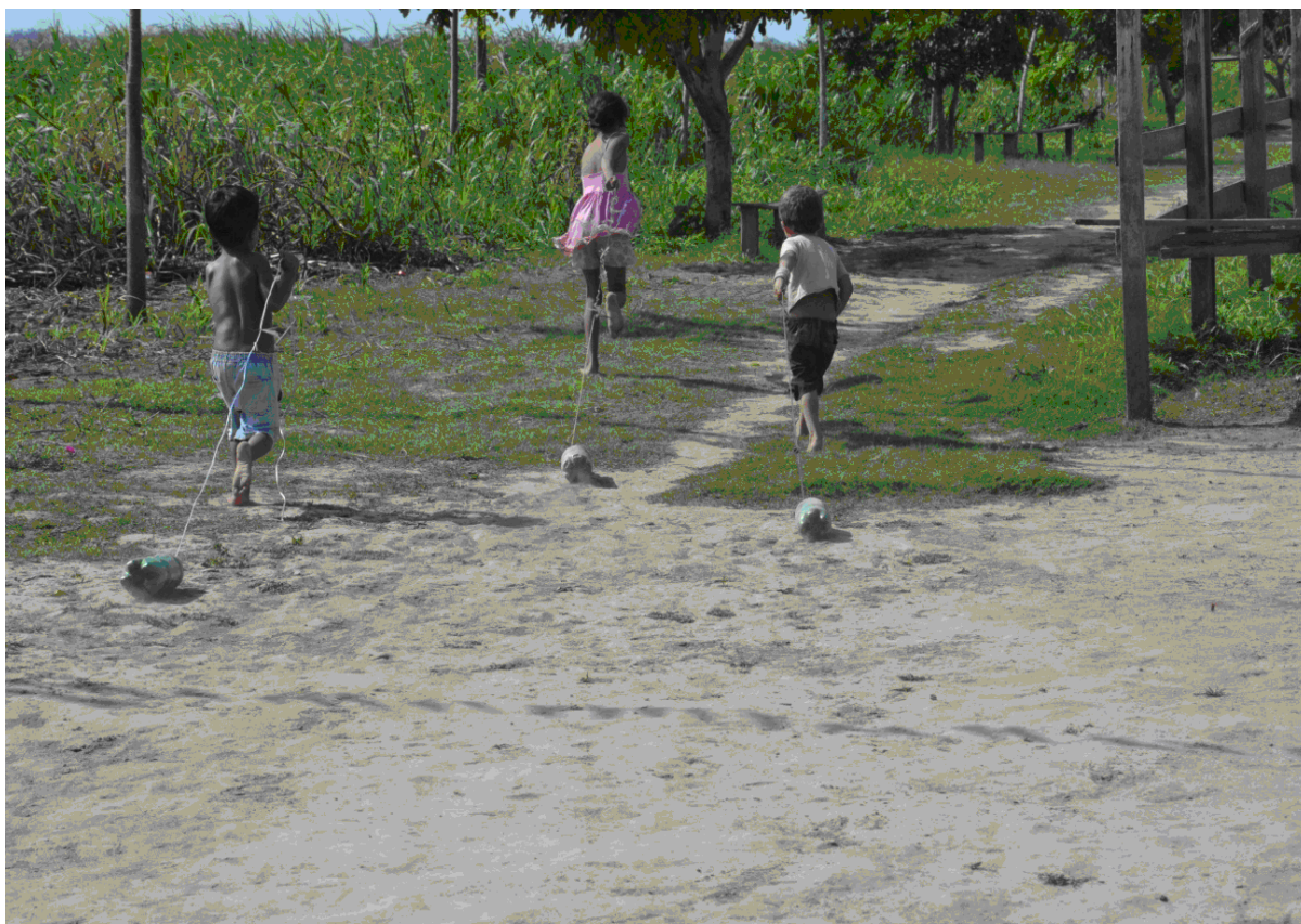
Figura 8 - Crianças brincando no quilombo de Saracura