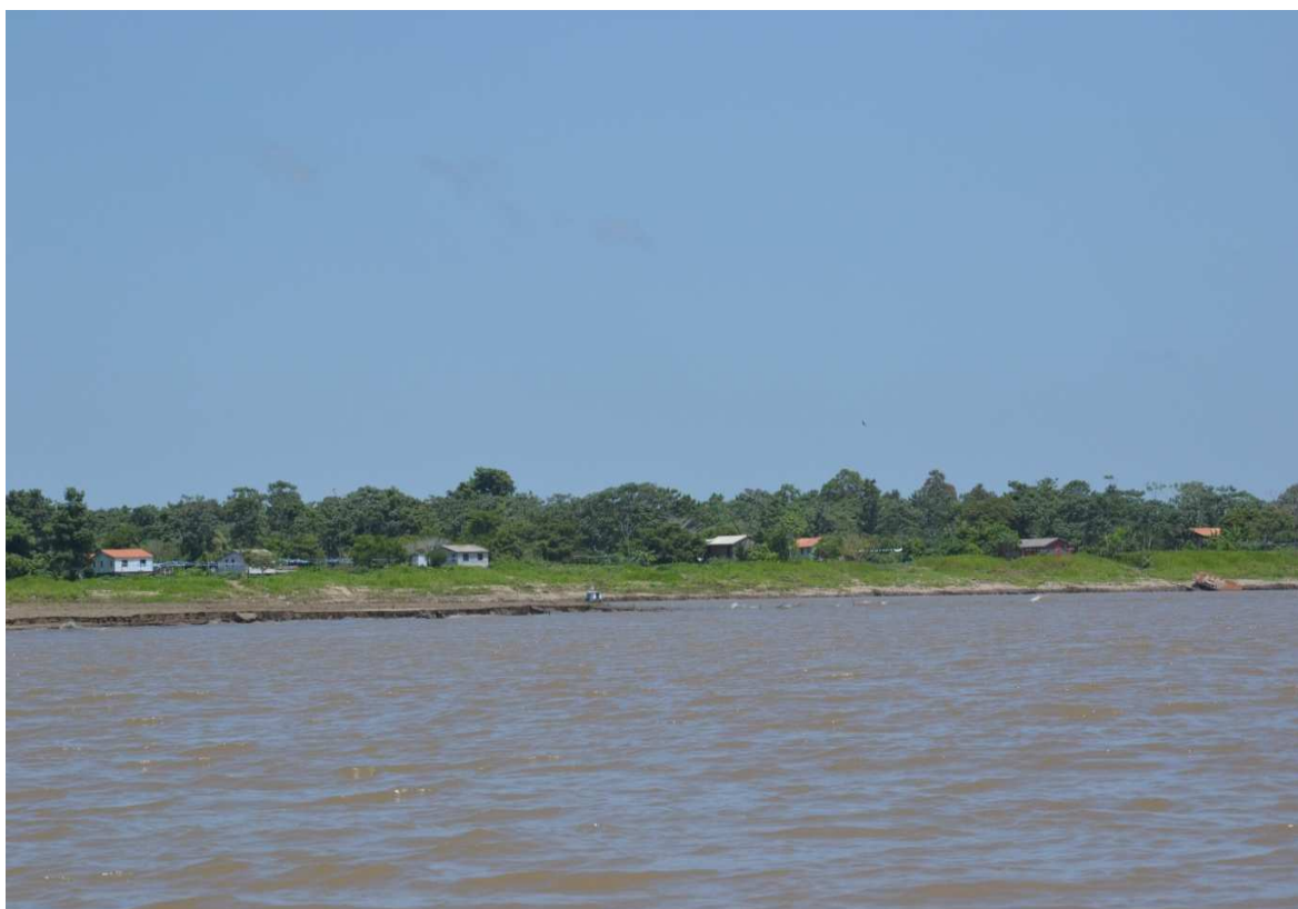
Figura 5 - Imagem da visão panorâmica da frente da comunidade de Saracura.