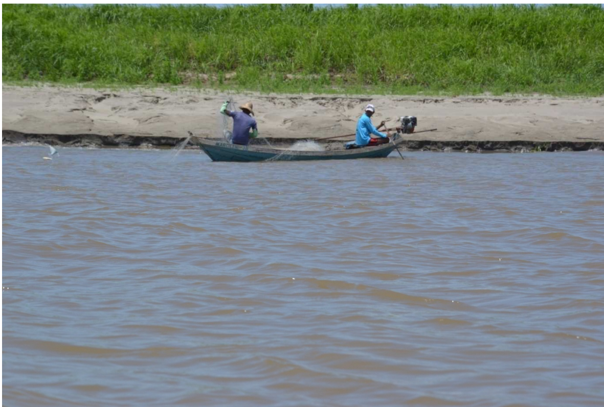
Figura 7 - Pescaria base econômica da comunidade de Saracura.

Considerando o legado econômico das 115 famílias residentes em Saracura, passamos a descrever as atividades que fazem parte deste legado. A maior atividade está baseada na pesca que são realizadas no Rio Amazonas e seus afluentes. O Rio Amazonas tem grande importância para as comunidades e municípios de seu entorno, não apenas pela sua alta navegabilidade e riqueza, mas pela variedade e quantidade de pescado. Também pelas suas terras de várzeas, com elevada fertilidade natural, em virtude da deposição cíclica de sedimentos, ricos em nutrientes.