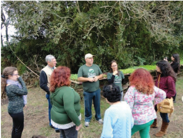
Figura 37 - Visita a Granja Santantonio