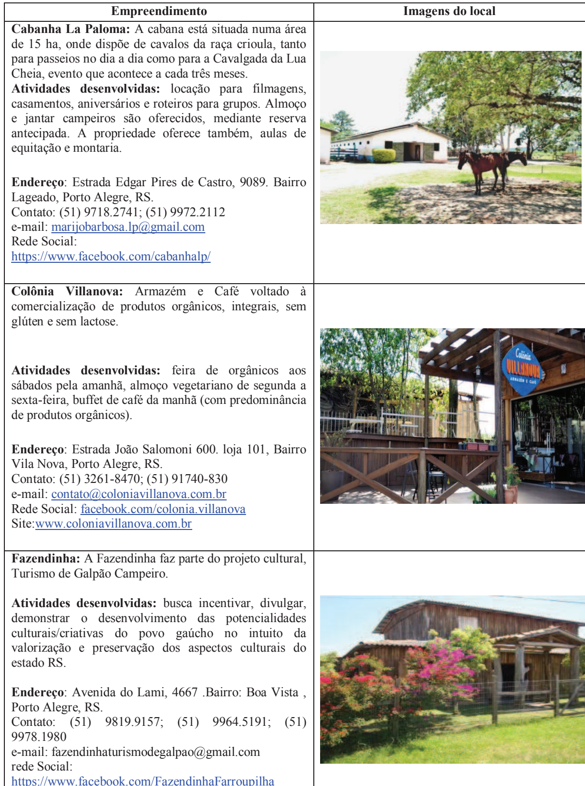
Figura 5 - Associados POARURAL