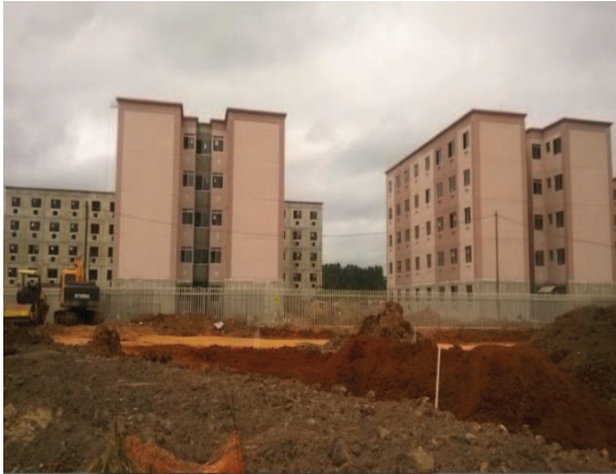
Figura 3 - Desmatamento para novos empreendimentos