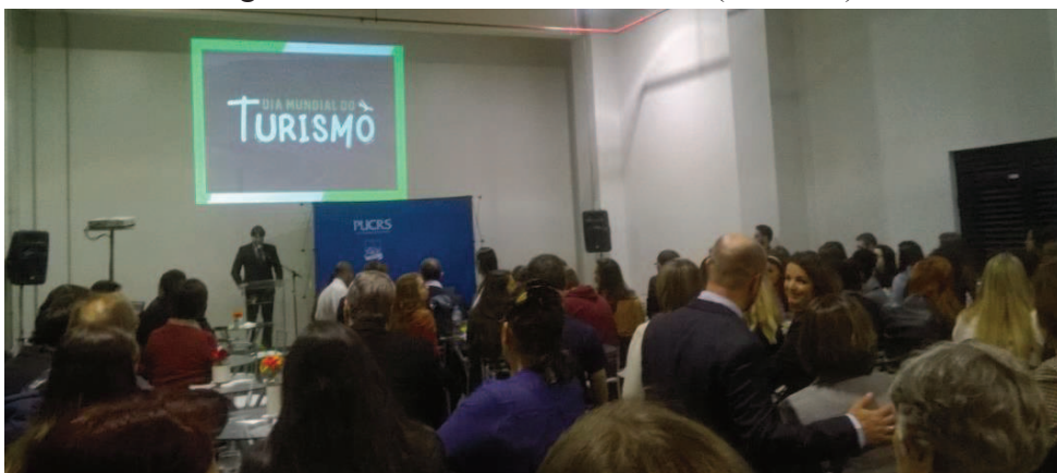
Figura 9 - Dia Mundial do Turismo (PUC/RS)