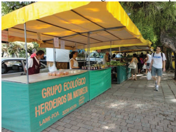
Figura 25 e 26 - Grupo Ecológico Herdeiros