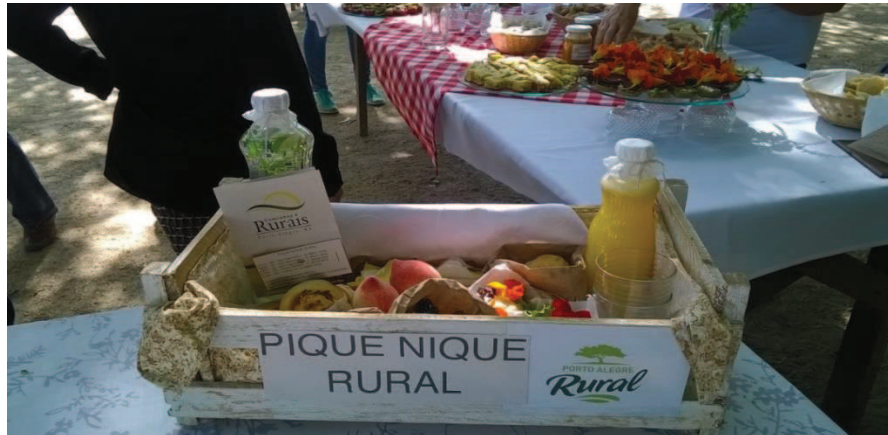
Figura 8 - Produto - Piquenique Rural