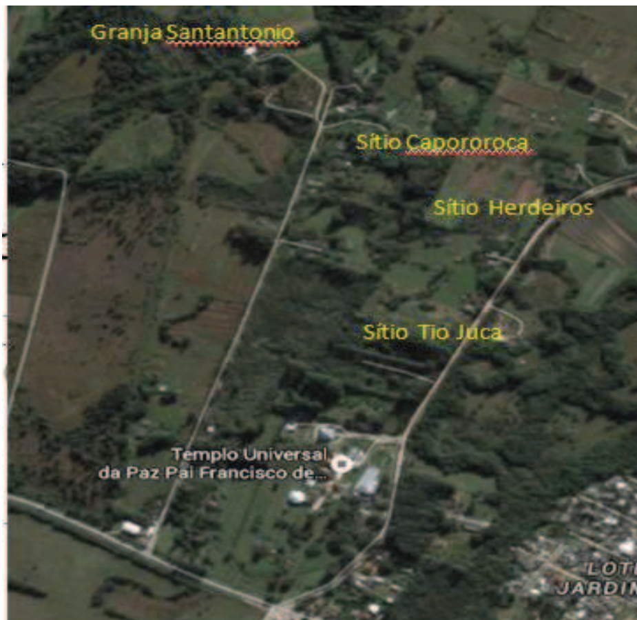
Figura 16 - Empreendimentos em estudo