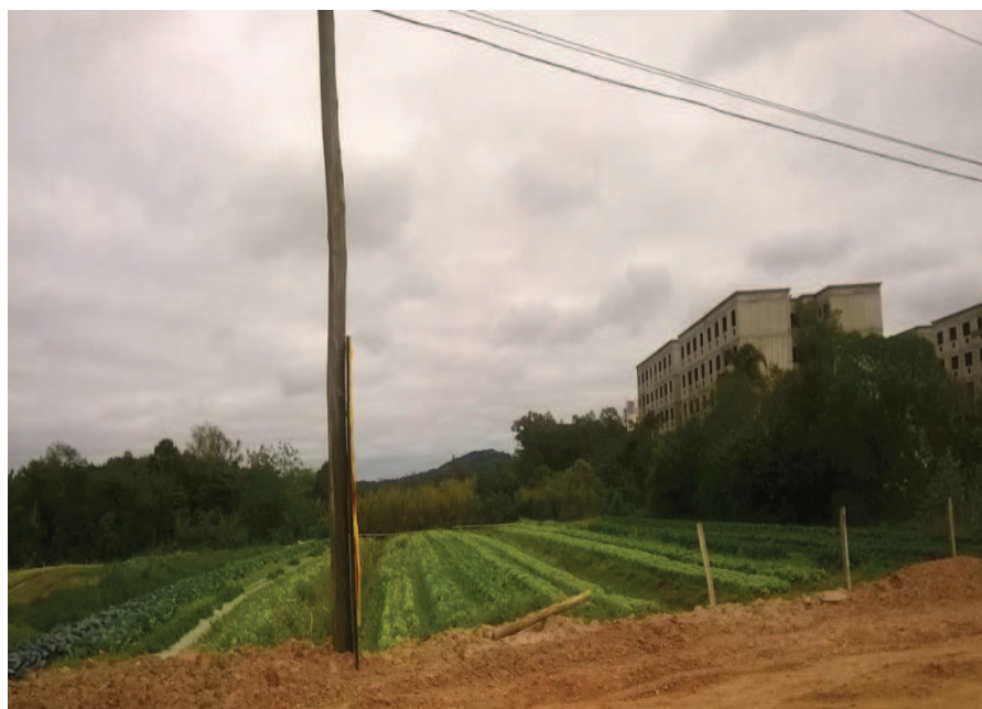
Figura 2 - Área tradicional de Cultivo de hortaliças ao lado dos novos condomínios