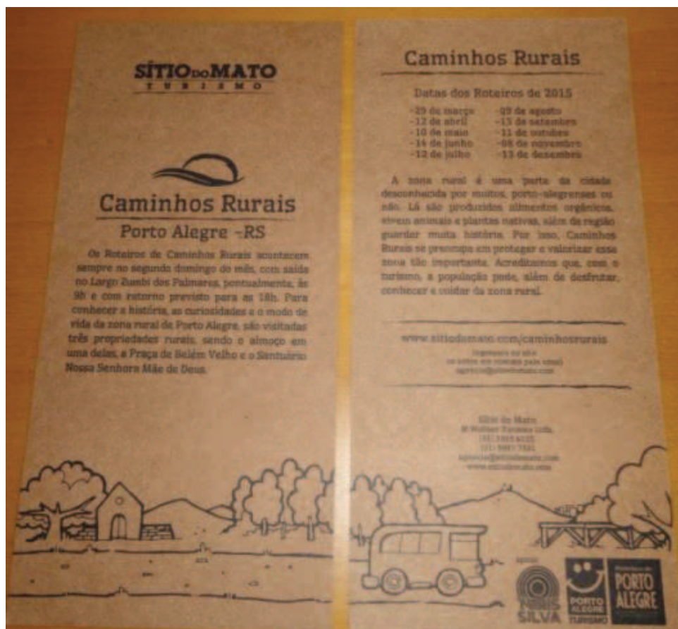
Figura 12 - Folder Sítio do Mato

A agência Sítio do Mato (Figura 12) é de um dos associados POARURAL. Ele comercializa o produto Caminhos Rurais de Porto Alegre com agenda mensal, no segundo domingo de cada mês, com saída do Largo Zumbi dos Palmares às 9h e retorno às 18h. A visita ocorre em três propriedades rurais, com alimentação e visita à Praça Belém Velho e ao Santuário Nossa Senhora Mãe de Deus.