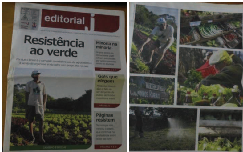
Figura 20 e 21 - Editorial J-Resistência ao Verde.