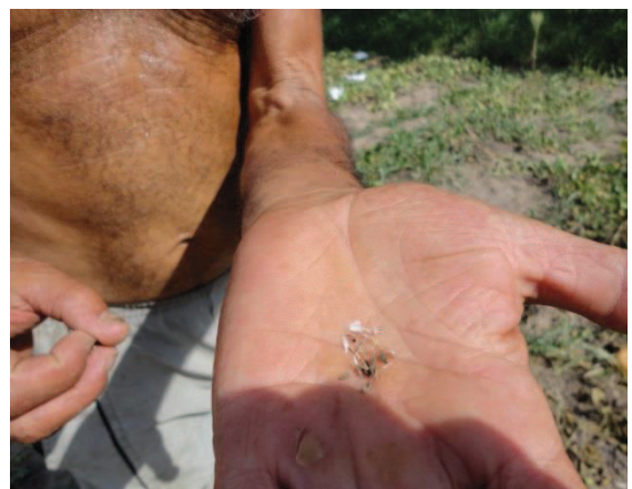
Figura 28 - Seleção de sementes na horta