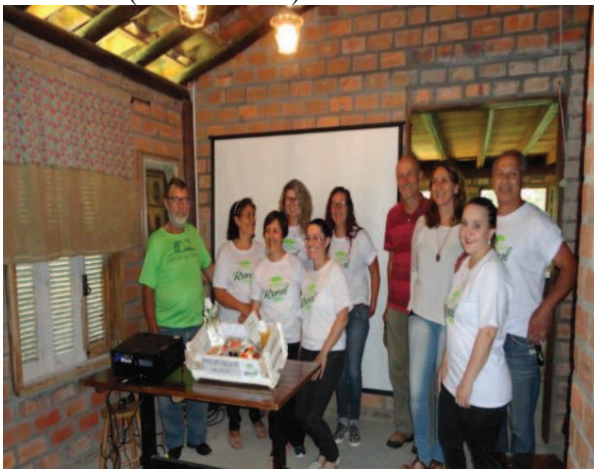
Figura 6 - Consolidação da Capacitação de Turismo (SENAR/RS)