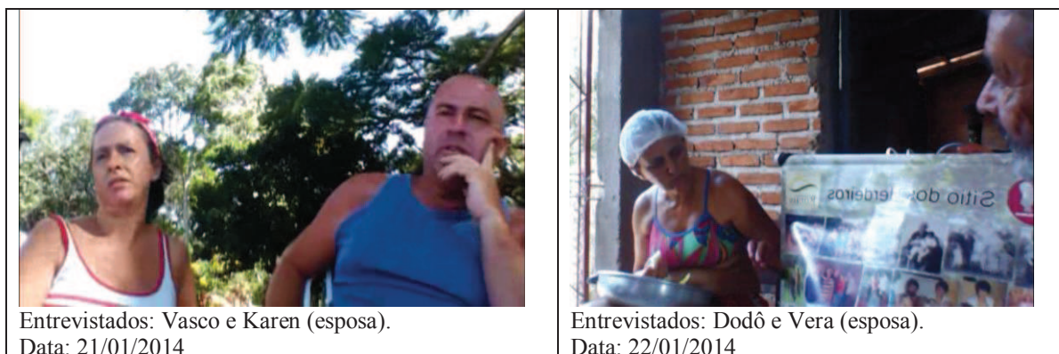
Figura 41 - Atores pesquisados

As entrevistas foram realizadas com dois grupos: os empreendedores de turismo rural que participaram do núcleo de turismo rural do Projeto Caminhos Rurais (Sítio Tio Juca; Sítio Herdeiros; Sítio Capororoca; Granja Santantonio) e os participantes de vivências, estágios e oficinas que ocorreram no Sítio Capororoca, no período em que a pesquisadora encontrava-se em regime de vivências no sítio e realizava incursões realizadas ao local (Figura 41).