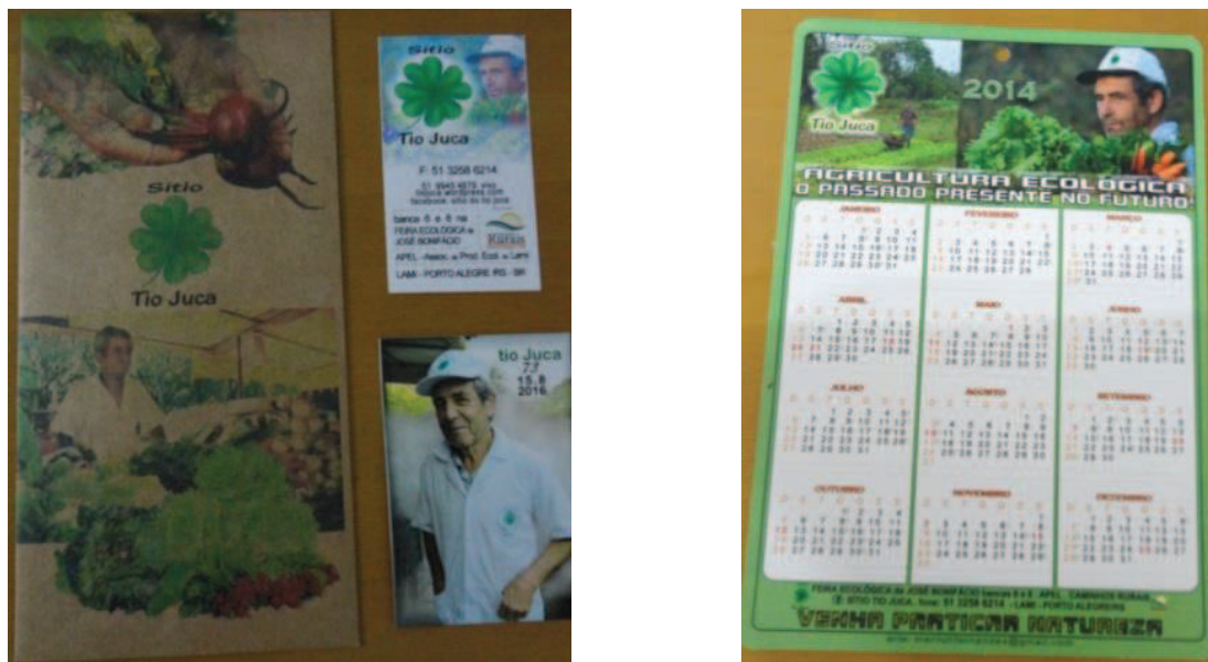
Figura 23 e 24 - Materiais de divulgação do Sítio