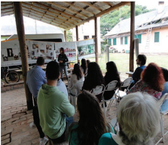
Figura 39 - História sobre Dona Mimi