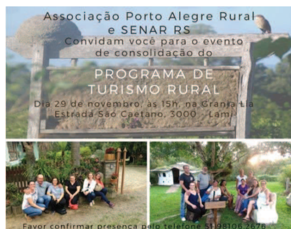
Figura 7 - Convite para o evento