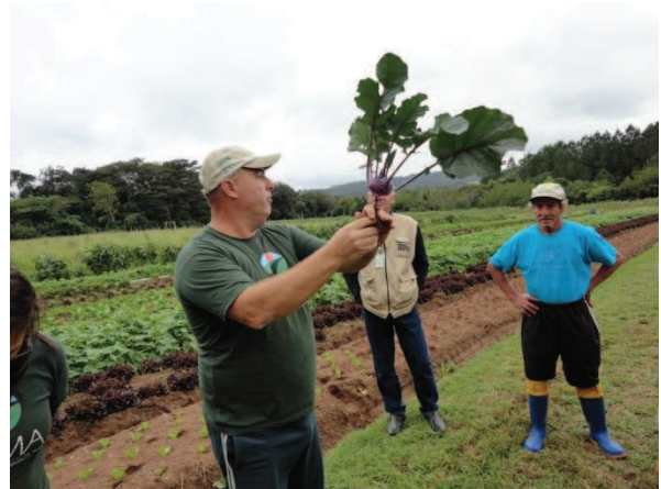
Figura 38 - Tipos de culturas do sítio