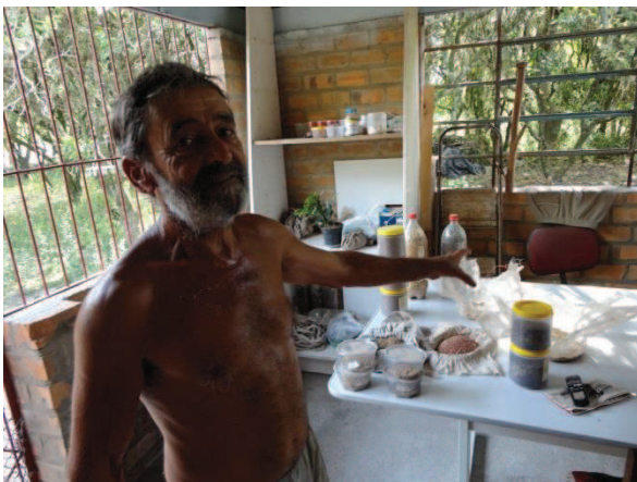
Figura 27 - Banco de sementes de Dodô