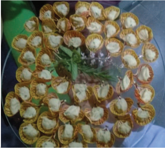
Figura 10 - Canapés com pétalas de Sininho