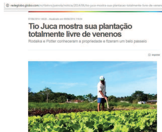
Figura 19 - Patrola