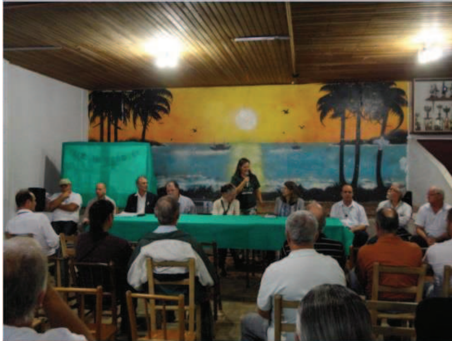
Figura 1 - Reunião Fórum do Extremo Sul