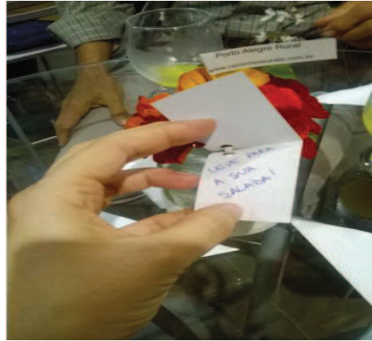
Figura 11 - Buquê de Capuchinhas