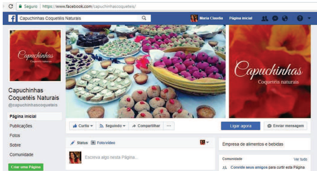
Figura 34 - Capuchinha Coquetéis Naturais