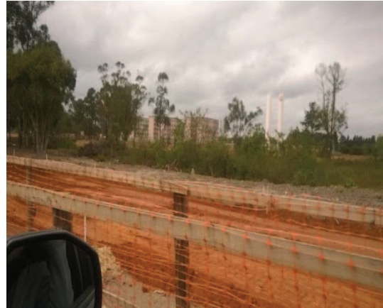
Figura 4 - Empreendimento imobiliário em processo de construção