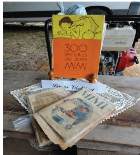
Figura 40 - Livros da culinária Mimi Moro