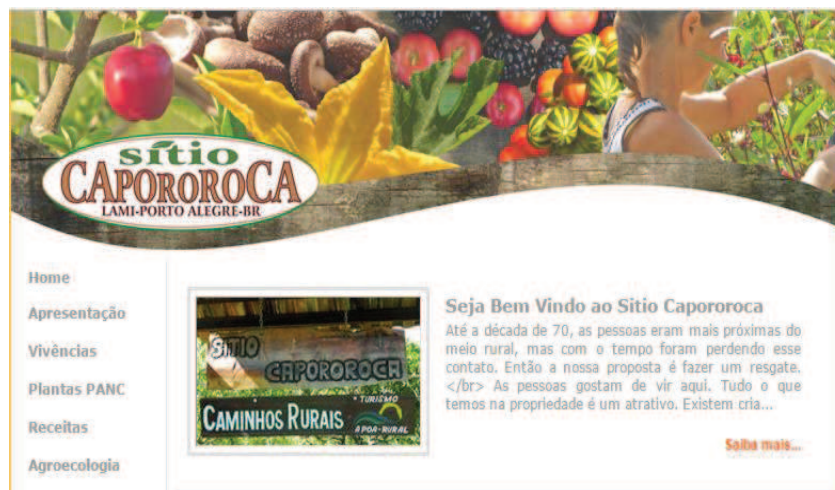
Figura 31 - Blog Sítio Capororoca