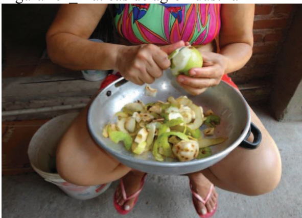
Figura 29 Práticas de agroindústria