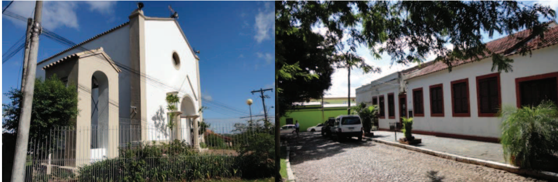
Figura 13 e 14 - Capela Nossa senhora de Belém e Casario