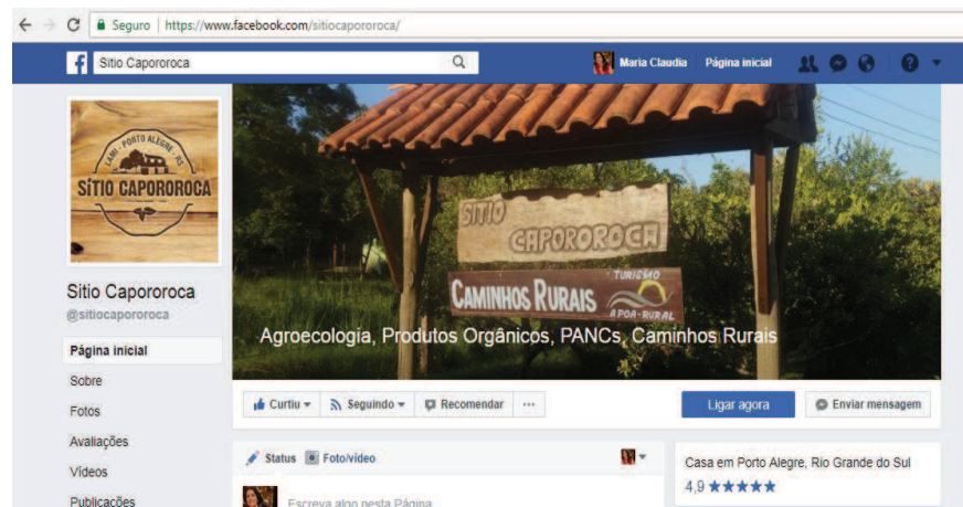
Figura 32 - página do Sítio Capororoca no facebook