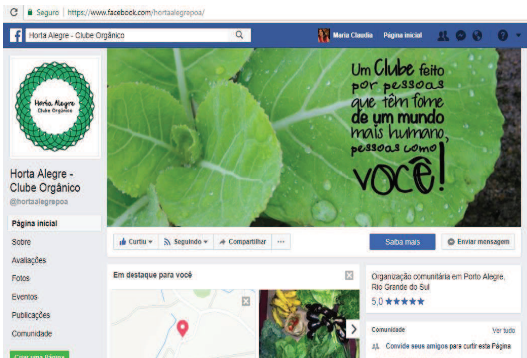
Figura 35 - Horta Alegre-Clube Orgânico