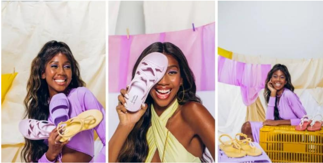
Figura 6 - Imagens divulgação campanha Zaxy do grupo Grendene