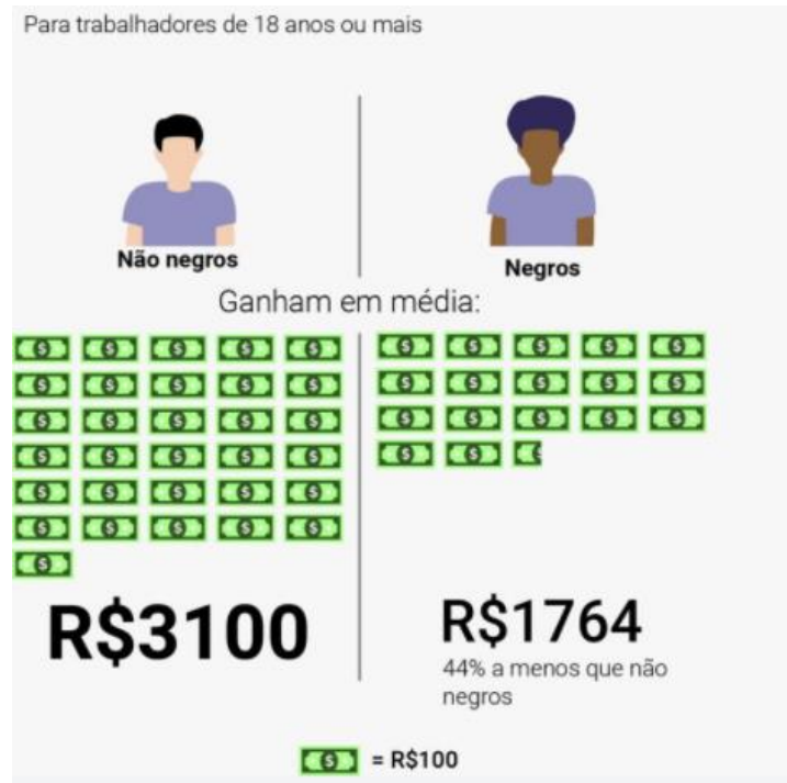
Figura 2 - Renda média de todos os trabalhos