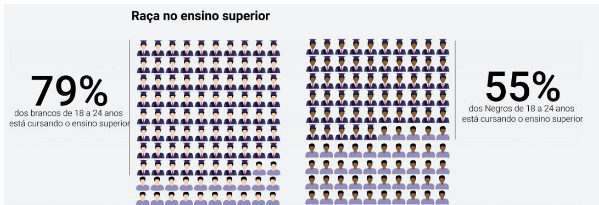
Figura 4 - “Raça” no ensino superior

Fonte: Observatório das desigualdades (2020).