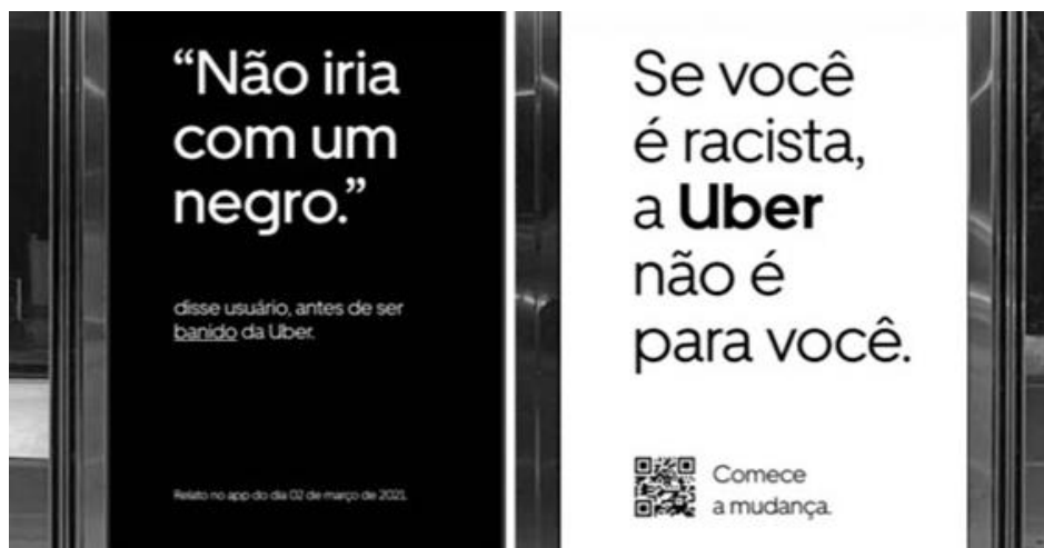
Figura 8 - Ilustração da campanha realizada pela Uber em 2021 contra o racismo

Em maio de 2021 a empresa Uber 17 lançou uma campanha onde convidava motoristas parceiros e usuários a se aliarem ao combate contra o racismo. Usando relatos reais de passageiros racistas, a campanha colocou na rua material ilustrando falas de usuários antes de serem banidos de utilizar o aplicativo. A ação teve duas fases, a primeira tinha objetivo de promover conteúdo educativo dentro da plataforma com esses exemplos reais., para isto, peças físicas em MUBs como ponto de ônibus, relógios e postagens em redes sociais. No segundo momento, a campanha visou mostrar como essas situações fazem parte de um racismo estrutural e a importância de entender o quão errado são essas atitudes. Em 2020, a empresa firmou compromisso global para combater o racismo, criando produtos igualitários por meio da tecnologia. Abaixo imagem ilustrativa da primeira fase da campanha.