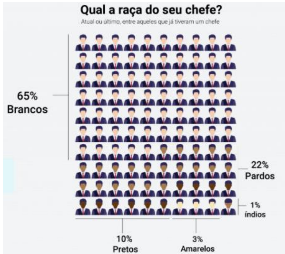
Figura 3 - Qual a “raça” do seu chefe