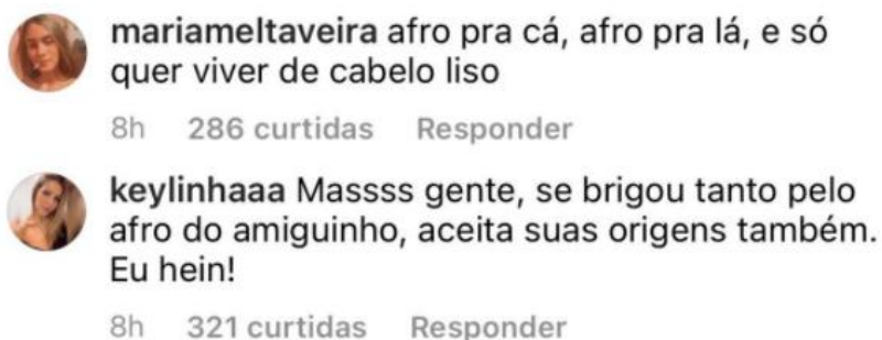
Figura 7 - Comentário sobre o uso de peruca durante a transição capital da influencer Camilla de Lucas

Mesmo recebendo todo este conhecimento, ainda sofre ataques por questões raciais. A influencer passa pelo processo de transição capilar, onde deixa de usar produtos de alisamento e assume seu próprio cabelo, sem influência de química. Neste processo, optou pelo uso de peruca e tranças e, após sua participação no reality, sofreu muitas críticas racistas por não mostrar o seu cabelo natural.