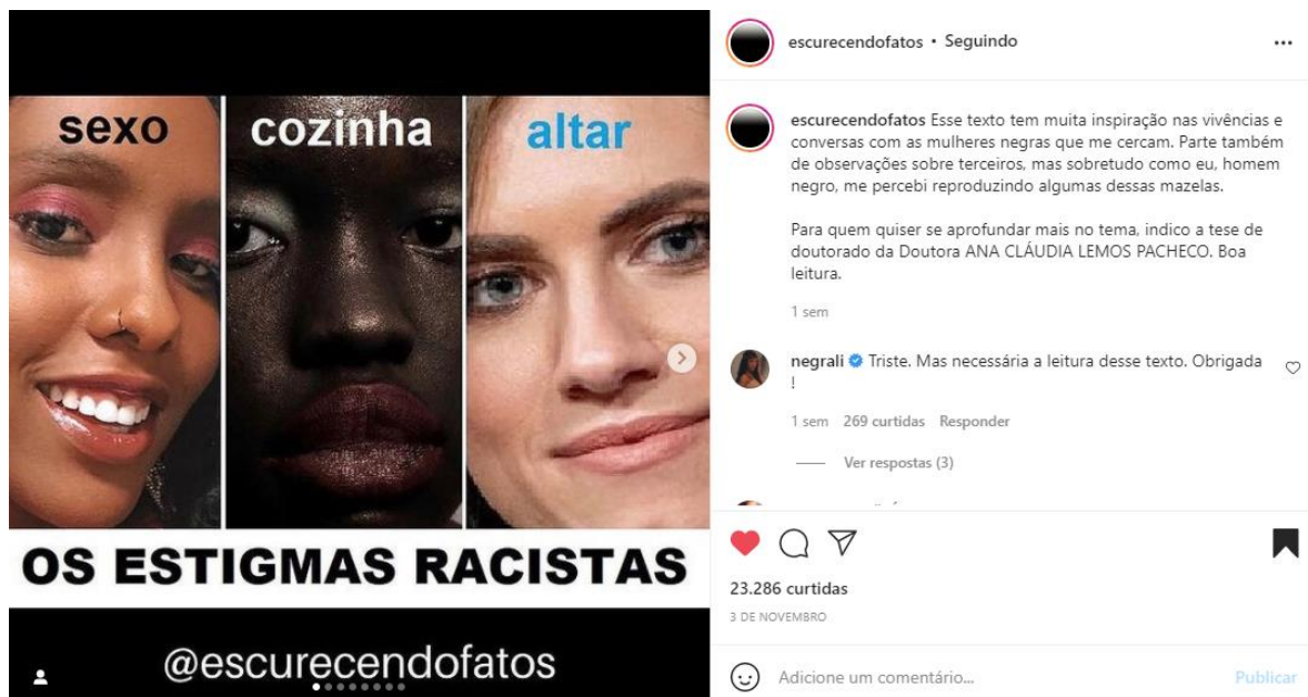
Figura 1 - Post sobre discussão racial perfil @escurecendofatos