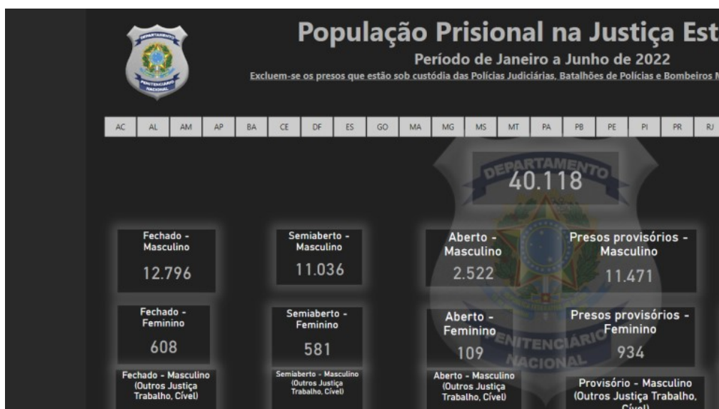
Figura 2 – População Prisional na Justiça Estadual – janeiro a junho de 2022

Em relação às “informações criminais”, observando os números específicos, são 608 mulheres no regime fechado; 581 no regime semiaberto; são 109 no aberto; 934 presas provisórias; e 1 em internação (SISDEPEN, 2022). Somando todos esses dados, o total são 2.233 encarceradas, o que não fecha com o número anterior, que apresentava o total como sendo 1.656. Para melhor demonstrar, apresenta-se a Figura 2: