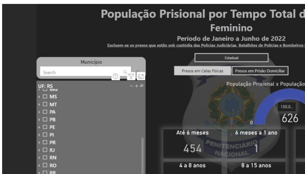
Figura 3 – População Prisional por Tempo Total das Penas – Feminino

Das mulheres que estão em prisão domiciliar, 454 cumprem pena de até 6 meses, 1 de 6 meses até um ano, 4 encarceradas cumprem de dois a quatro anos, 46 delas cumprem de 4 a 8 anos. De 8 a 15 anos são 74 mulheres, de 15 a 20 anos são 28 mulheres, de 20 a 30 anos são 14 mulheres e de 30 a 50 anos são 5 mulheres (SISDEPEN, 2022). Somando-se as indicações, o total são 626, exatamente o número informado anteriormente. A Figura 3 a seguir apresenta a população prisional por tempo total das penas, no que diz respeito ao enquadramento feminino.