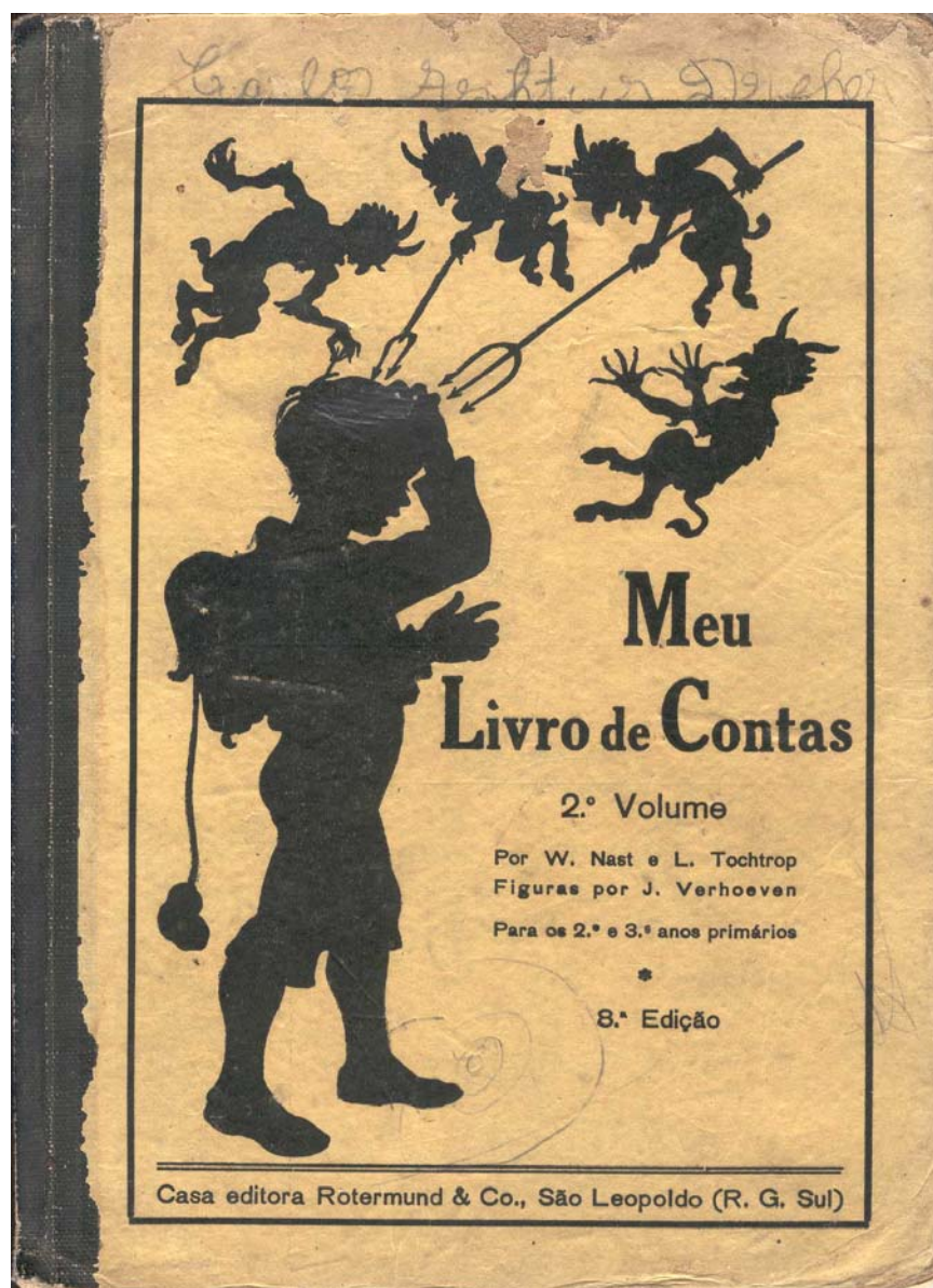
Figura 6 – Capa da cartilha Meu Livro de Contas , vol. 2.

Pelos desenhos expressos nas capas das cartilhas, pode-se pensar a constituição da linguagem da matemática escolar com as marcas do diabólico, inacessível e masculino. Em ambas as capas, há a presença de figuras que simbolizam demônios, satanás ou capetas, pela presença de um nariz grande e envergado, garras, rabos e lanças, que, na segunda capa, estão dirigidas à cabeça do menino. Tais figuras permitem associar a matemática escolar com a geração do medo e também com algo maligno e infernal. Além disto, diria que, pela indicação das flechas presentes na segunda capa (em direção à cabeça do menino), a matemática escolar estaria vinculada à cognição, ao raciocínio abstrato.