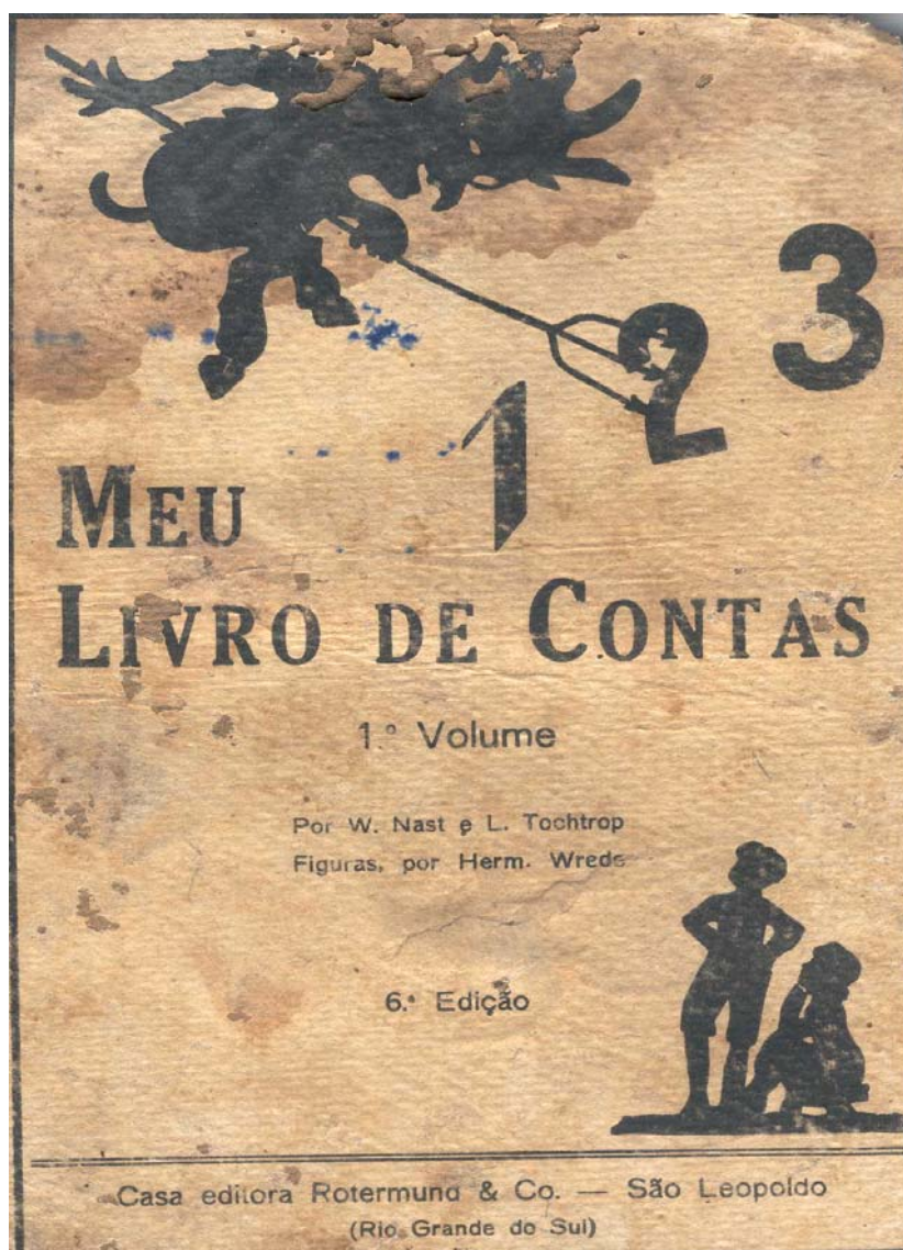
Figura 5 – Capa da cartilha Meu Livro de Contas , vol. 1.

As capas das cartilhas de matemática utilizadas na escola de Costão durante a Campanha de Nacionalização são emblemáticas para a análise da produção de significados sobre a matemática escolar do período: