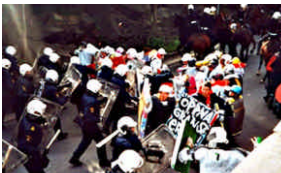
FIGURA 2 – Ativistas em embate com a polícia durante protesto em Göteborg, Alemanha, em junho de 2001.