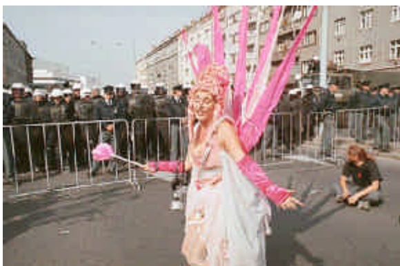
FIGURA 1 – Ativista durante a Silver-Pink March (“Marcha Prata e Rosa”) em Praga, 26 de setembro de 2000.

O caráter lúdico, bem como a dramatização e/ou a teatralização, constitui de saída uma oposição ideológica à seriedade e ao racionalismo do universo corporativo, político ou das grandes organizações internacionais. Em alguns momentos formam também oposição visual: são emblemáticas as fotos dos Dias de Ação Global onde a massa negra formada pelos policiais se bate contra a multidão colorida de manifestantes. Além da surpresa que provocam naqueles que querem impedir o protesto, os ativistas acabam por construir uma composição de cores convidativa às câmeras fotográficas dos jornalistas. 76