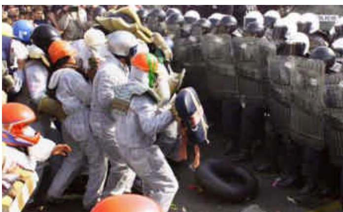
FIGURA 3 – Ativistas do grupo italiano Tute Bianche em frente à polícia durante a Yellow March (“Marcha Amarela”) em Praga, 26 de setembro de 2001.