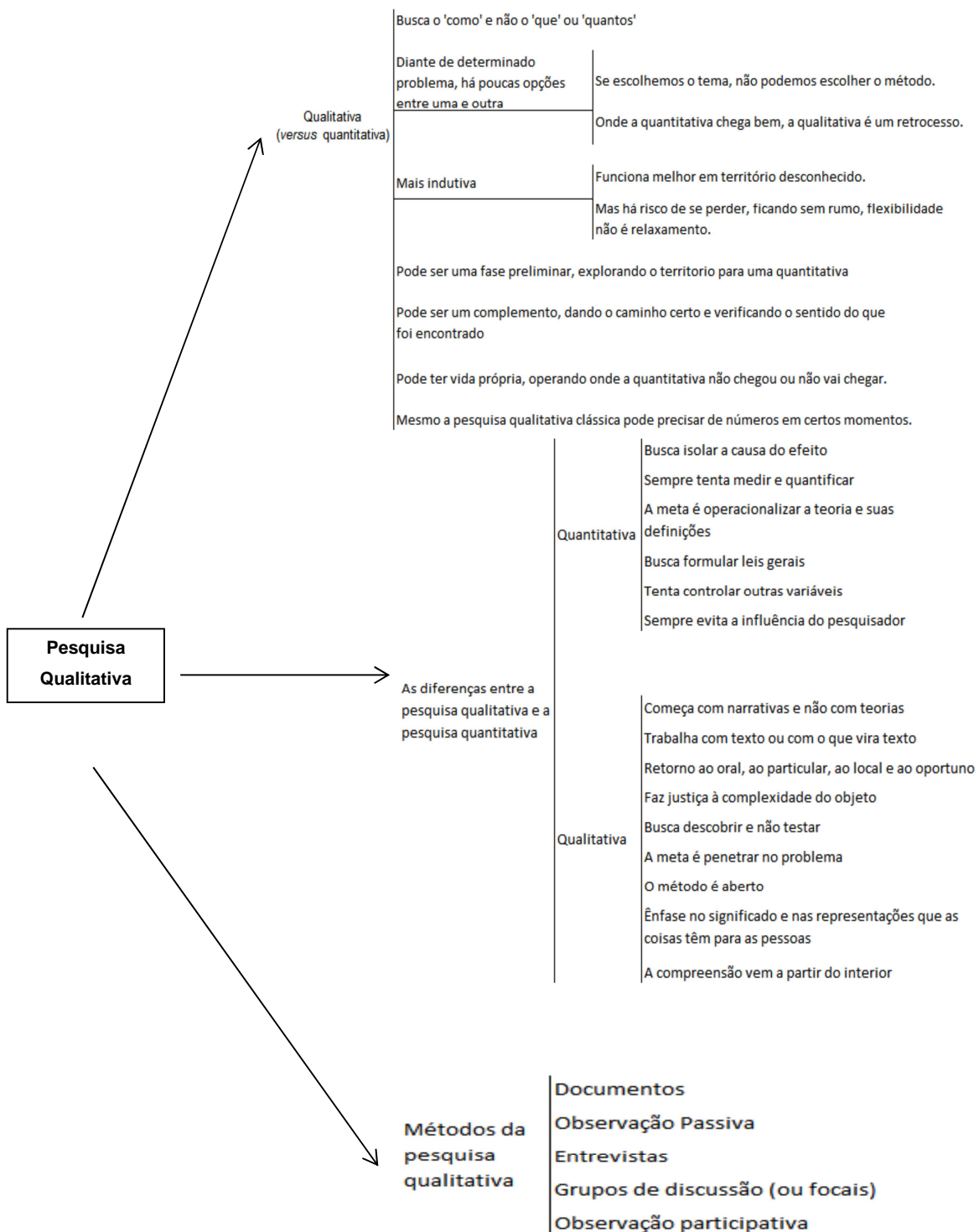
Figura 2 - Diferenças de abordagem de pesquisa