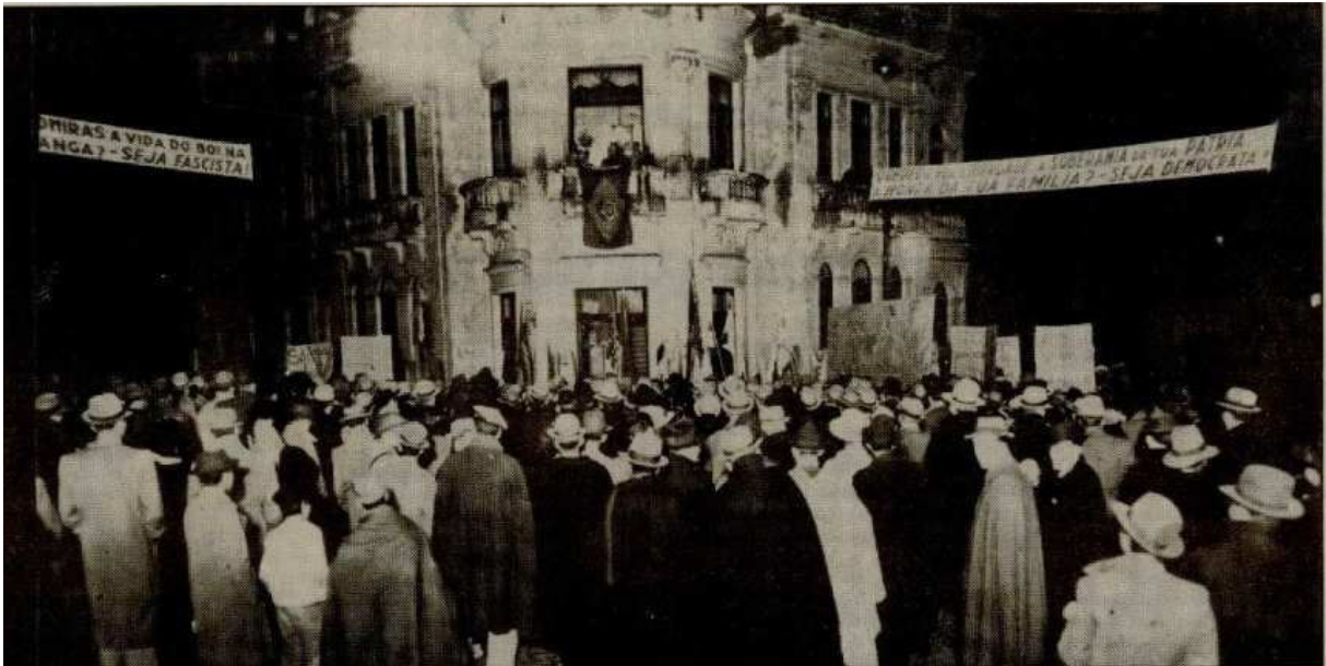
Figura 9 - Manifestação nacionalista em frente ao clube Juvenil, Caxias, mai. 1942.