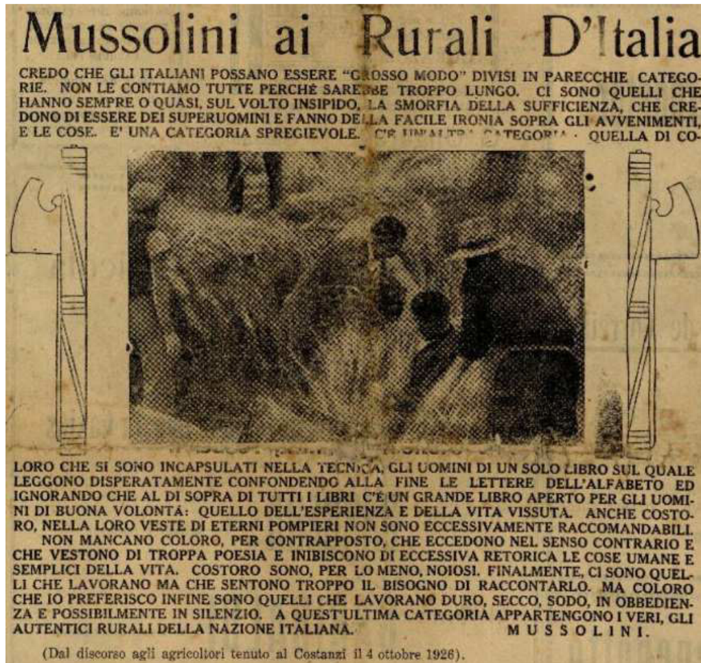
Figura 6 - Extrato da capa da primeira edição