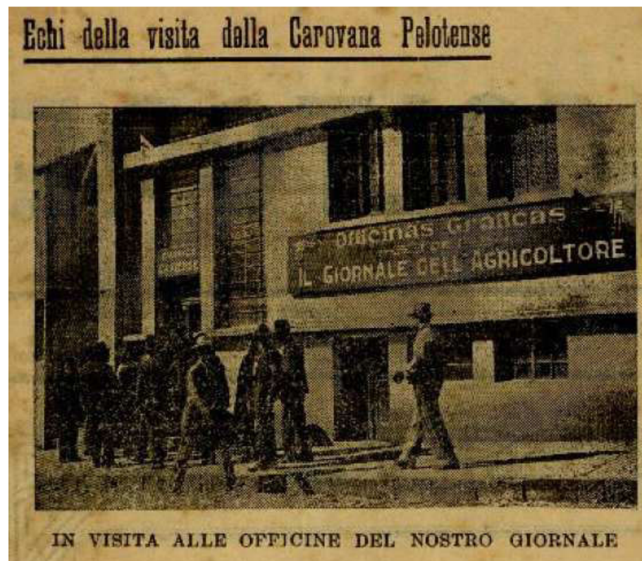
Figura 3 - Foto do edifício sede do jornal