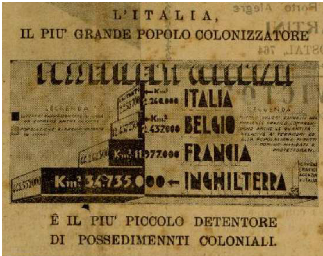
Figura 12 - Gráfico de posses coloniais