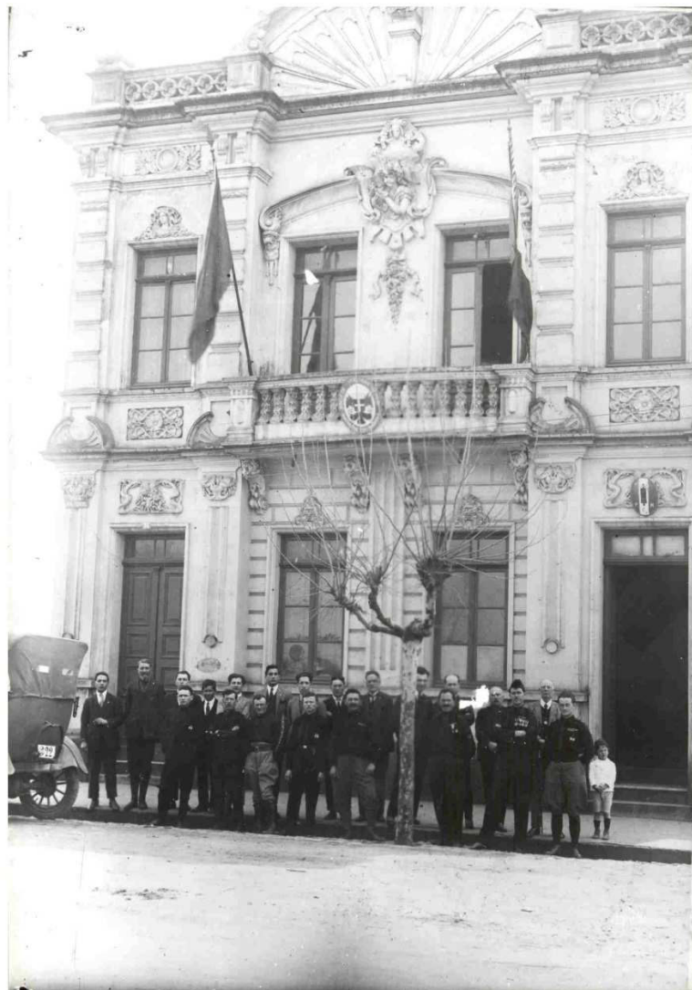
Figura 10 - Membros do fascio em frente à sede da Sociedade Principe di Napoli

Fonte: Arquivo Histórico Municipal João Spadari Adami, coleção Studio Geremia, GER(REP)179.