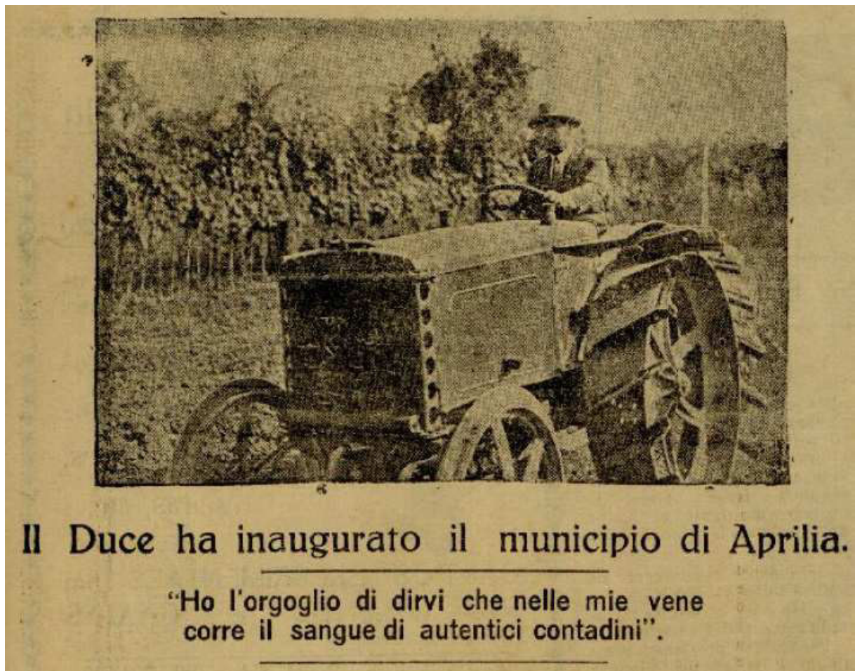
Figura 7 - Mussolini guiando trator