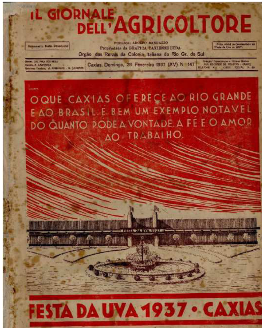
Figura 5 - Capa da edição especial da Festa da Uva de 1937