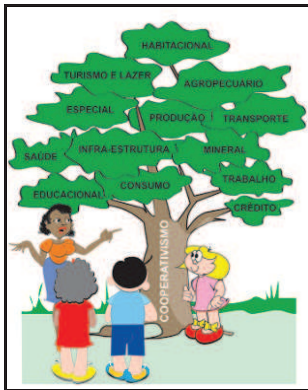
Figura 1 – Configuração de cooperativa singular ou de primeiro grau

Na figura 1, temos uma visualização da configuração de uma Cooperativa Singular, ou de primeiro grau. As cooperativas estão agrupadas por categorias econômicas.