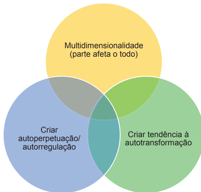
Figura 1 - Condições de aprendizagem estrutural

Por ação autônoma e contínua, conforme aponta Sasson (2006), apenas pode ser considerada uma aprendizagem efetiva (não local) aquela que é estrutural, ou seja, que obedece a três condições inter-relacionadas, conforme Figura 1: