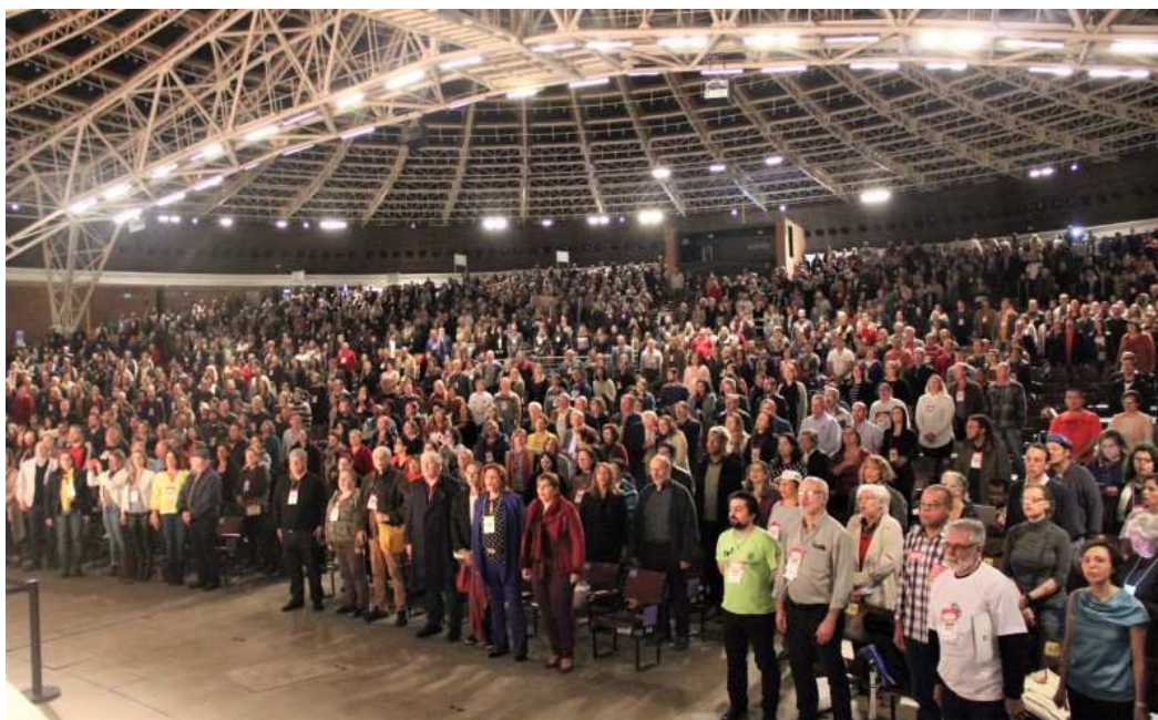
Figura 1. 8ª Conferência Estadual de Saúde, Auditório Araújo Vianna, Porto Alegre (RS), 2019.

Já a 8ª Conferência Estadual de Saúde ocorreu em 24/05/2019, no auditório Araújo Vianna contou com a participação de mais de 3 mil pessoas (Figura 1).