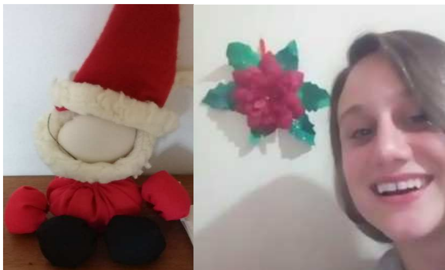
Figura 3. Artesanatos feitos por mim junto ao grupo de artesanato, 2019.

Grupo de artesanato: participavam 4 usuárias e 1 enfermeira. Como se aproximava da data natalina confeccionávamos enfeites para a árvore de Natal (figura 3). Enquanto isso, em conversa com as mulheres, elas relataram melhora na qualidade de vida após participarem desse grupo. Antes tratava-se do grupo de saúde mental oferecido pela UBS (que não estava mais ativo), ali se conheceram e sugeriram para a equipe utilizar aquele espaço para um grupo de artesanato. As participantes usuárias eram quem organizavam as atividades que seriam realizadas ali, sendo que uma delas, a enfermeira, atuava mais como uma mediadora. Transmitem a sensação de estarem à vontade de ocupar aquele espaço, com boas conversas e brincadeiras.