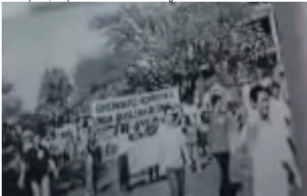
Fotografia 2 - Concentração dos participantes da passeata, diante do Palácio Farroupilha, enquanto a Comissão entregava o documento ao Governador