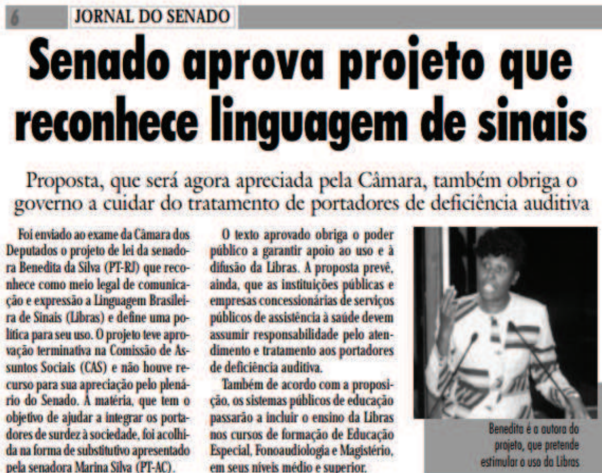
Figura 4 – Senado aprova PL nº 131/96