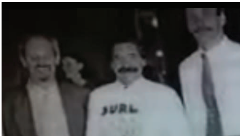
Fotografia 3 - O Governador do Rio Grande do Sul, Olívio Dutra (centro), ao receber da FENEIS o documento do Pré-Congresso, com o diretor da FENEIS/RS, Carlos Goes (esquerda) e juntamente com o presidente da FENEIS, Antônio Campus de Abreu (direita)