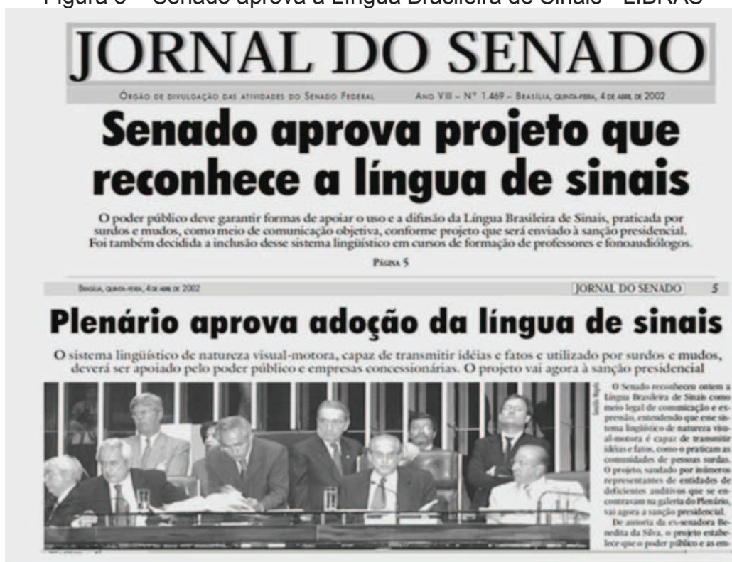
Figura 5 – Senado aprova a Língua Brasileira de Sinais - LIBRAS

A Mesa se congratula com a Associação dos Surdos de Brasília, que nos honram com suas presenças, bem como com a Federação Nacional de Educação e Integração de Surdos. [...] Acabamos de aprovar, certamente, a lei mais humana, mais cristã e humanitária do Senado da República, desde que nos encontramos aqui, a lei que aprova os sinais como expressão da manifestação do ser humano, daqueles que, por uma razão ou outra, foram privados dos seus sentidos (BRASIL, 2002, p. 3680).