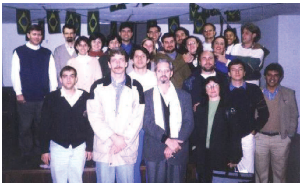
Fotografia 1 - Participantes do I Encontro de Direitos Humanos da SSRS em 1998

Com o reconhecimento da Libras sendo alcançado em alguns estados e cidades do país, o movimento pela oficialização em nível nacional ganhou mais legitimidade. Houve maior emprego de força em direção à visibilidade das lutas do povo Surdo que buscava ainda mais garantir centralidade nas discussões.