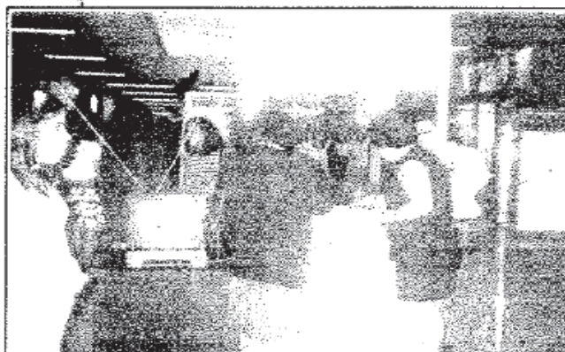
Stand para coleta de assinaturas no Shopping Iguatemi em Maceió

A FENEIS agradece a todos os que estão empenhados nesta campanha, inclusive aos Senadores Teotônio Vilela Filho e Renan Calheiros, que já se engajaram na luta. Ao lado do modelo do formulário para as assinaturas que deverão ser enviadas diretamente a FENEIS/BH, no seguinte endereço: FENEIS, Seção Minas Gerais, Rua Albita, 144, Cruzeiro, Belo Horizonte, MG, CEP: 30.310-160, telefax (031) 225-0088.