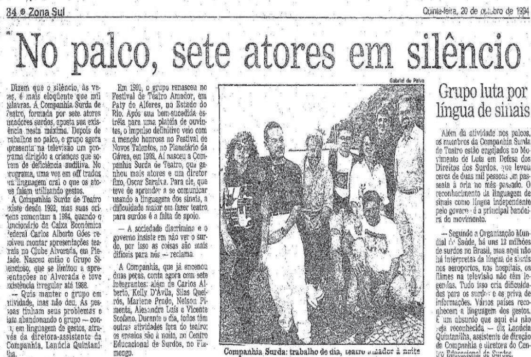
Figura 1 – Companhia Surda de Teatro - 1994