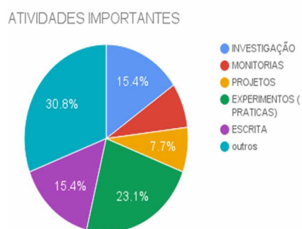
Gráfico 2: Atividades desenvolvidas pelos bolsistas

Sobre as atividades desenvolvidas pelo PIBID, destaca-se a importância de experimentação, como se constata no gráfico 2.