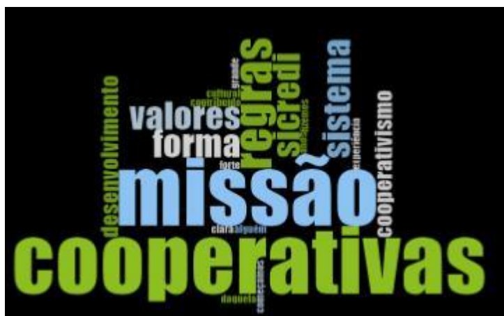
Figura 5 – Frequência de palavras

Observando-se as palavras que apareceram com maior frequência, destacam-se palavras chaves para o tema, tais como missão, regras, valores, sistema. A nuvem de palavras é feita a partir de um recurso do software Nvivo que conta as palavras que aparecem com maior frequência na categoria de análise codificada. A partir de uma lista de palavras com maior frequência, é possível gerar a figura em formato de nuvem de palavras. Na figura 5, é apresentada a frequência de palavras, onde fica em destaque a missão e as regras.