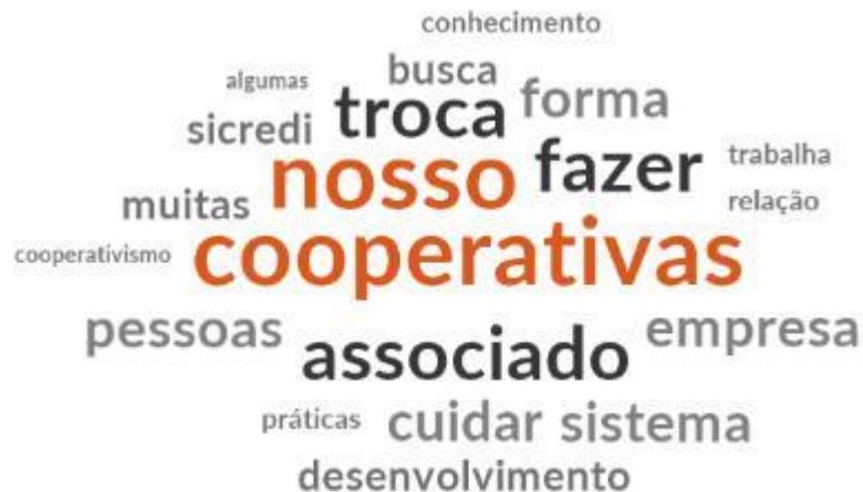
Figura 4 – Frequência de palavras

Analisando e codificando as respostas das entrevistas no software Nvivo , observou-se uma relação nas palavras que apareceram com maior frequência. A nuvem de palavras é feita a partir de um recurso do software Nvivo , que conta as palavras que aparecem com maior frequência na categoria de análise codificada. A partir de uma lista de palavras com maior frequência, é possível gerar a figura em formato de nuvem de palavras. Nosso, cooperativa, pessoas, associados, empresa, sempre no sentido de colaboração e cooperação. Algumas palavras orbitam cooperativas e têm sentido com a intercooperação, tais como pessoas, fazer, troca. Na figura 4, é apresentada a frequência de palavras.