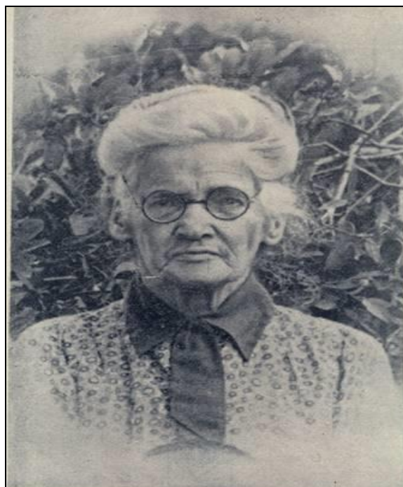
Figura 1 - Ana Aurora do Amaral Lisboa

É nesta localidade que se inserem os Amaral Lisboa e nossa personagem, Ana Aurora. De acordo com Regina Abreu (1994, p. 66-84), indivíduos podem ser alvo de um processo de “monumentalização”, ou seja, algumas figuras públicas se tornam parte do patrimônio de certa região, como no caso de Ana Aurora do Amaral Lisboa em Rio Pardo.