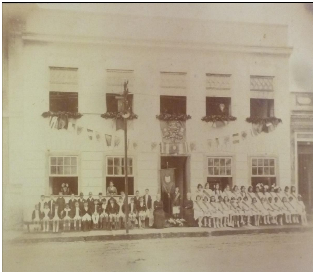
Figura 3 - Antigo Colégio Amaral Lisboa