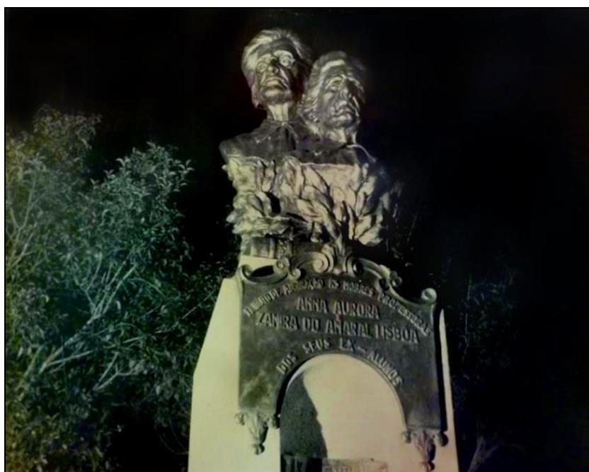
Figura 2 - Busto de Ana Aurora e Zamira do Amaral Lisboa

Em 24 de setembro de 1944, na Praça Barão de Santo Ângelo, em Rio Pardo (RS), foi inaugurado um monumento: bustos de bronze das irmãs professoras Ana Aurora e Zamira do Amaral Lisboa.